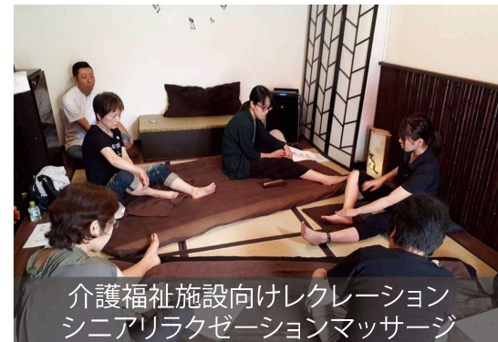
介護福祉施設向けレクレーション シニアリラクゼーションマッサージ