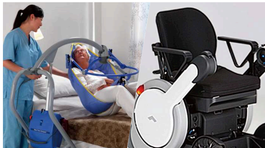
最新福祉機器展示/試乗会