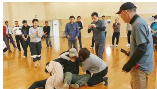
JET KRAVMAGA 長崎支部 福祉施設職員向け護身術講習

長崎県の介護周辺・健康サービスを考える会 地域創生ケアビジネス研究会 九州ヘルスケア産業推進協議会 (HAMIQ)