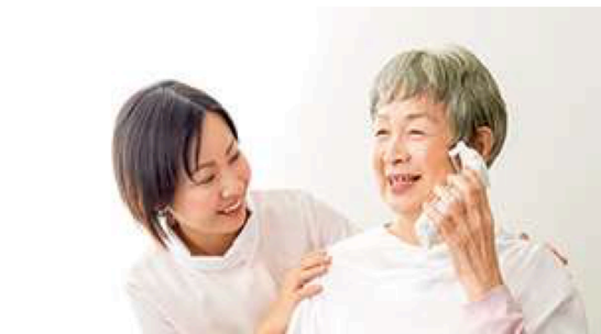
一般社団法人 日本介護美容セラピスト協会