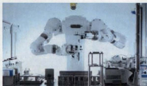
汎用ヒト型ロボット LabDroid「まほろ」

※ ロボット・シェアリングとは、世界の第一線の研究者のみがもつ高難易度な実験技術を実装した汎用ヒト型ロボット LabDroid「まほろ」を共同利用することにより、高度な研究分析技術を全ての研究者が共有・再現することを可能とする新しい仕組みのことです。RBI株式会社は、国立研究法人産業技術総合研究所と株式会社安川電機により共同開発した LabDroid「まほろ」に、九州大学で確立された優れた実験プロトコールを実装し、共同研究を推進します。