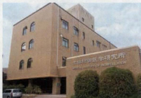
共同研究開発ラボ 九州大学・生体防御医学研究所